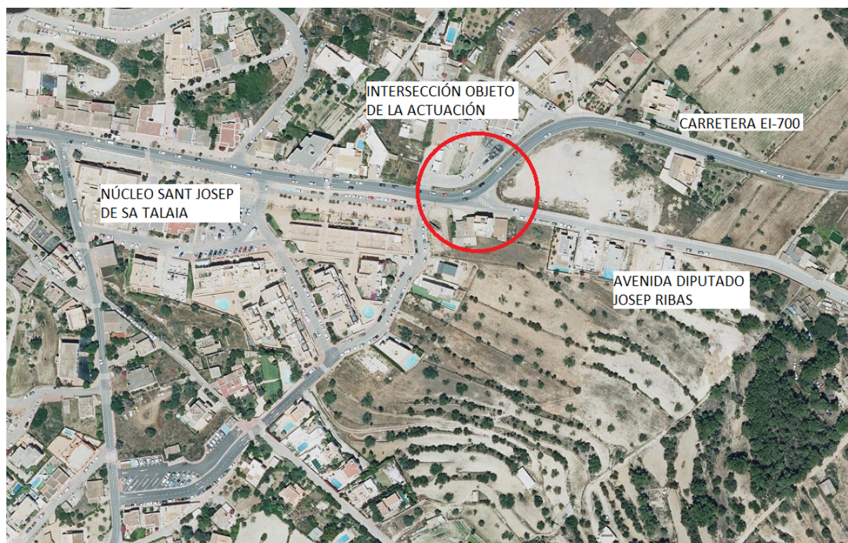
Imagen 1. Fotografía aérea del ámbito de actuación de la obra.

La intersección se encuentra en una de las entradas del núcleo urbano de Sant Josep de sa Talaia y conecta la carretera EI-700 con la avenida del Diputado Josep Ribas. En esta avenida se encuentran equipamientos, actividades y parcelas particulares, por lo que tiene tráfico significativo.