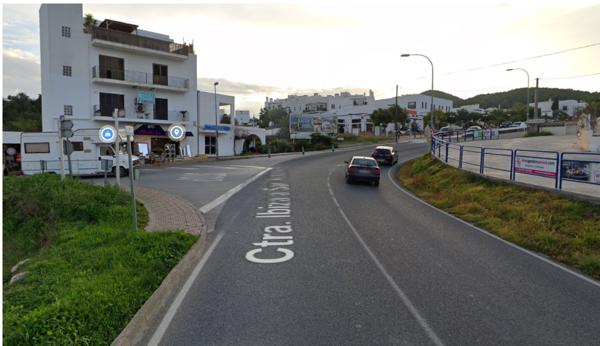
Imagen 2. Vista de la intersección, desde la carretera EI-700 sentido ascendente.

Además, esta glorieta permitiría realizar cambios de sentido y así eliminar también otros giros a la izquierda que se producen en las proximidades de la intersección y que también provocan situaciones de riesgo.